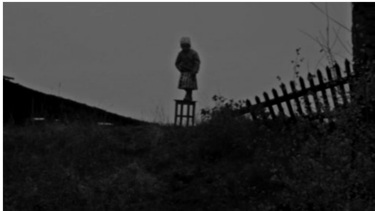
© Clément Cogitore / ADAGP, Paris 2017